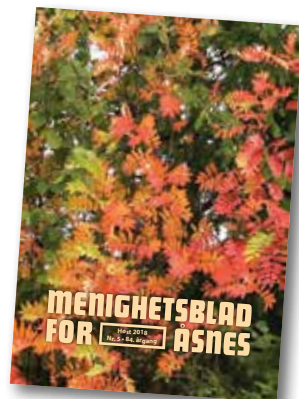
Rogn i høstdrakt.

Adressen til Åsnes kirkelige fellesråd sin nettside er: www.kirken.no/asnes