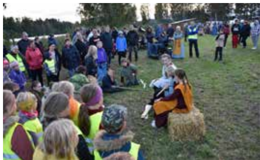
7. trinnselever fra Jara skole med skuespill om runer på kveldsarrangementet på Strandsjø.