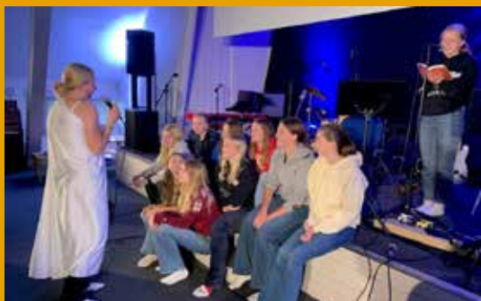
Konfirmantene var med på å dramatisere bibelfortellinger. De var flinke!