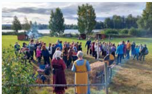
Alle 6. trinnselevne i Åsnes ønskes velkommen til skoledag med jernalderaktiviteter på Strandsjø.

På kveldstid fredag var de samme aktivitetene åpne for alle. Skoleelever og barnehagebarn i Åsnes med foresatte/familie var spesielt invitert, og alle andre var invitert til arrangementet gjennom plakattoppslag og innslag i lokalradioen og lokalavisene. Det var mellom 400 og 500 mennesker til stede på kvelden. Elever fra Jara og noen fra Sønsterud bidro da i aktivitetene med bl.a. skuespill/tablåer, sangleiker, balanseleik, matservering og skinnpung-laging.