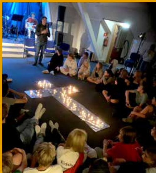
Kveldsavslutning, og konfirmantene samles rundt lyskorset på gulvet.