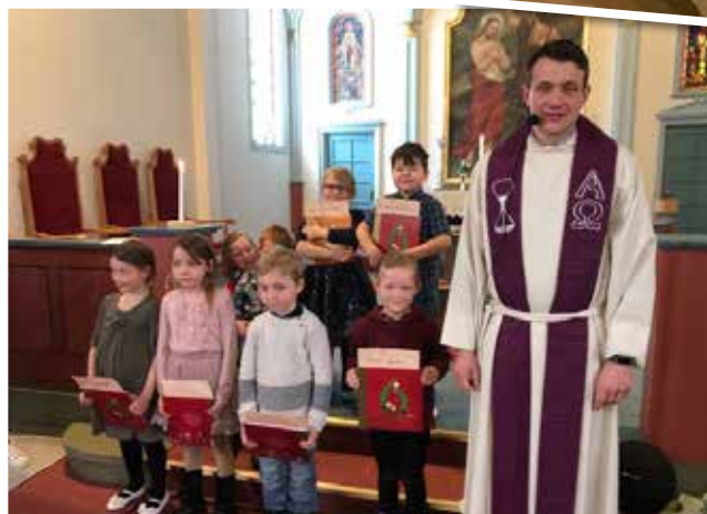
7 gutter og jenter fikk 6-årsbok i Gjesåsen kirke søndag 8. mars.