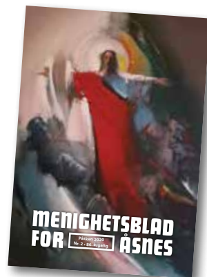
"Oppstandelsen" Maleri fra Medjugorje i Bosnia Herzegovina, kunstner ukjent, Foto: Ingrid

Åsnes kirkelige fellesråd: www.kirken.no/asnes