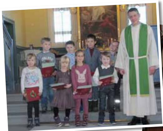
Det var mange som mottok sin 6-årsbok ved Åsnes Finnskog kirke søndag 23. februar.