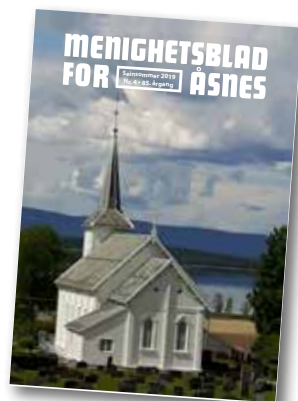
Gjesåsen kirke.