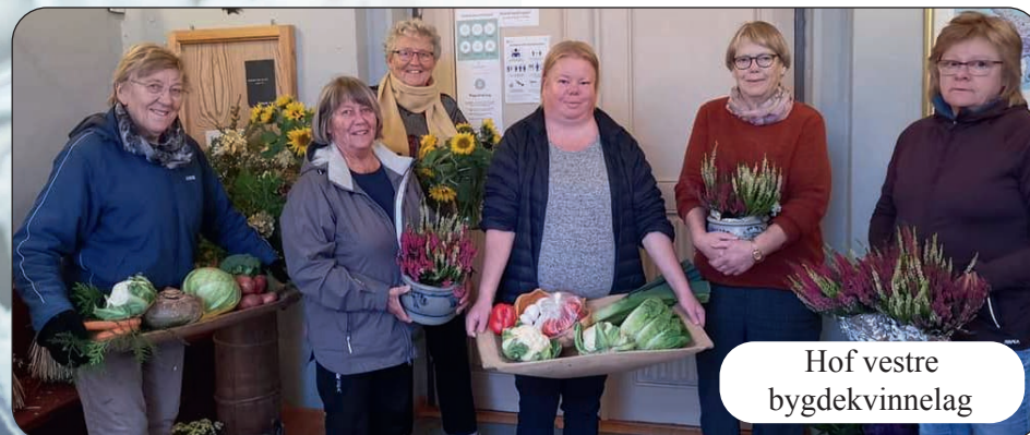
Hof vestre bygdekvinne- lag