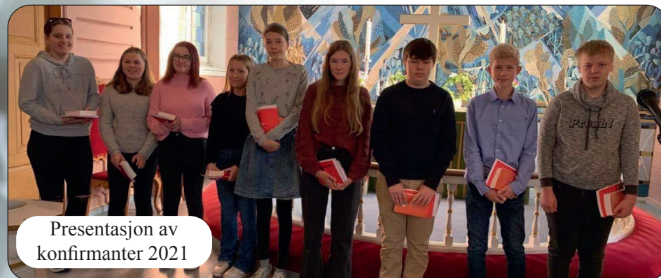
Presentasjon av konfirmanter 2021