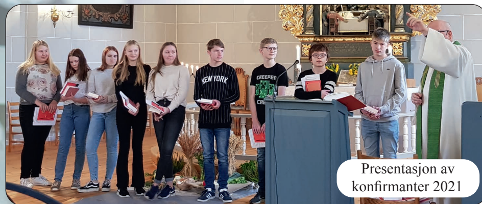
Presentasjon av konfirmanter 2021