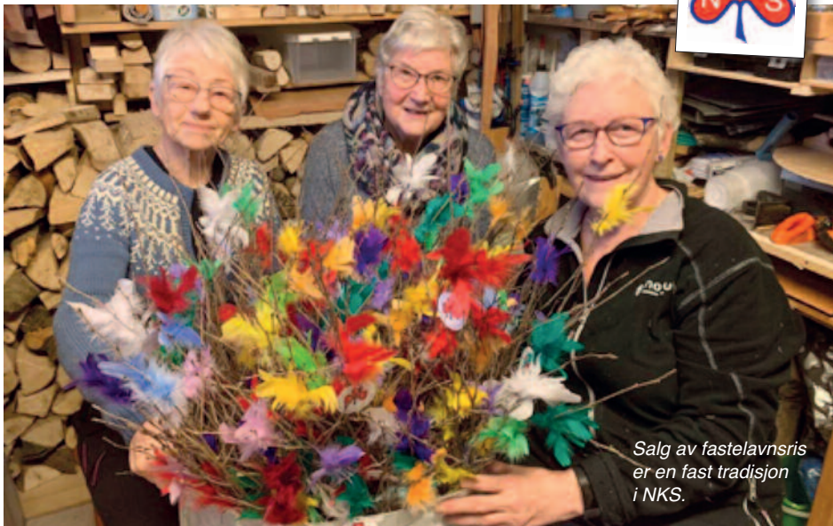
Salg av fastelavnssris er en fast tradisjon i NKS.