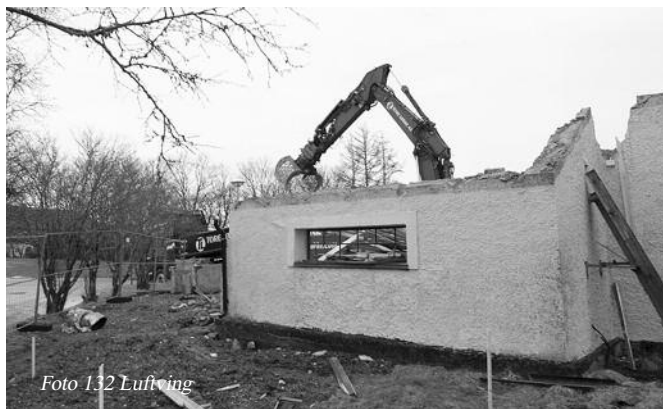
Foto 132 Luftving

Murhuset på den lille bakketoppen er nå borte. Opprinnelige var det okkupasjons-makten som bygde dette i 1942, og noe av den historiske kunnskapen er bevart. Jeg er fremdeles interessert i kunnskap om bygningen og de folkene som har brukt det i ulike sammenhenger. Ta kontakt!