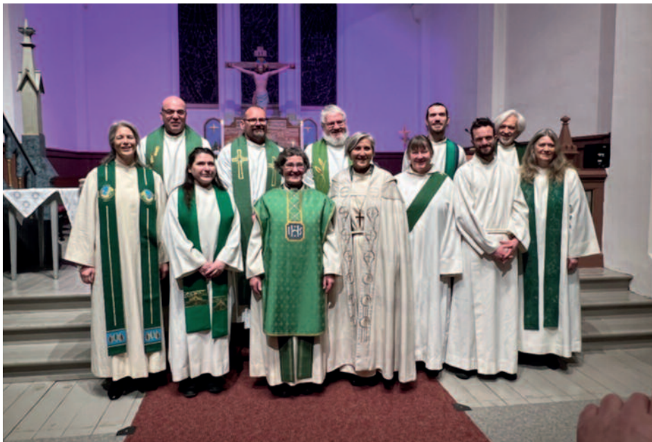
Biskop og prost omgitt av prester i Fosen prosti.

liten hørt fortelling om det som skjedde da Jesus ble født, - om engler og hyrder og kanskje om vise menn fra Østerland. Vi kan regne med at Johannes allerede så Jesus som en spesiell mann, kommet fra Gud. Derfor reagerte Johannes når Jesus kom, han kunne ikke forstå at Jesus trengte å bli døpt for å endre livet og leve rett.