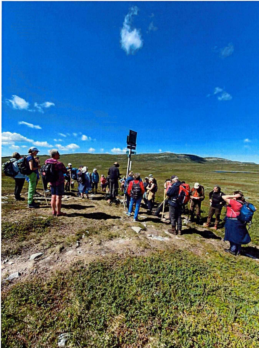
Pilegrimstur 2022: Liten rast med påfyll av energi på Slepeskaret 27. juli 2022