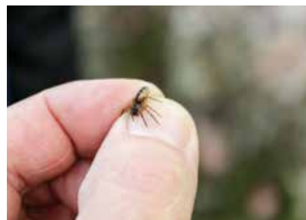
En liten bit av skaperverket.