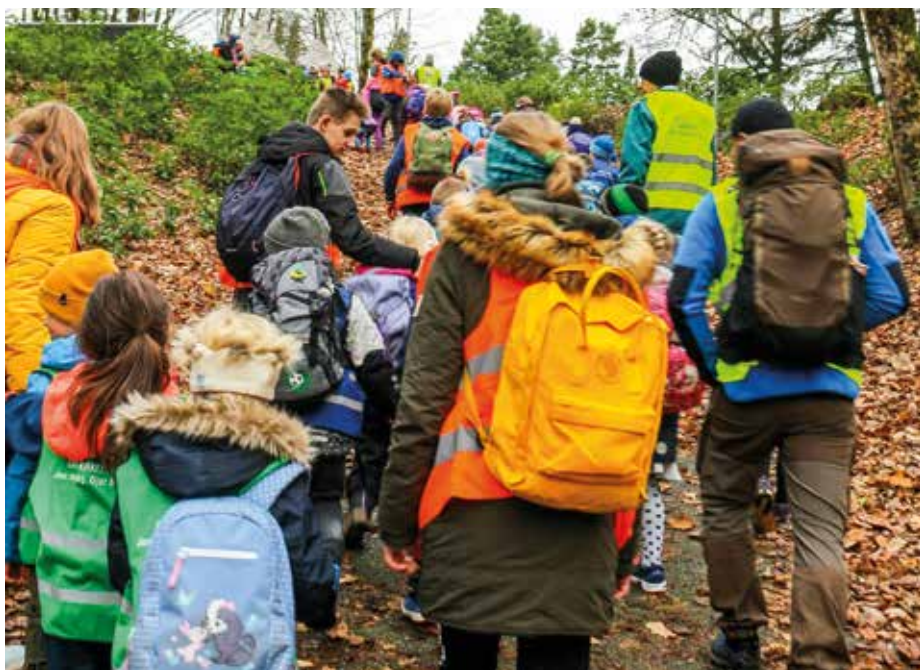
Miljødetektiver på tur.

For mer informasjon og påmelding se www.gand.no/midti2klasse Pris kr 100. Ta kontakt om økonomi er en utfordring. Invitasjon sendes til medlemmer i Den norske kirke, men arrangementet er åpent for alle 2. klassinger, uavhengig av medlemskap. Håper å se deg som går i 2. klasse denne dagen!