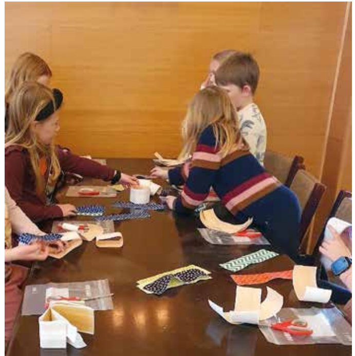
Vi lager plaster.

Kvart årstrinn har sitt eige opplegg, og Tilstede vil gjerne minne om at i november kjem opplegget for 2.trinn – Miljødetektivdagen! Kyrkja ser gjerne så mange som mogleg då!