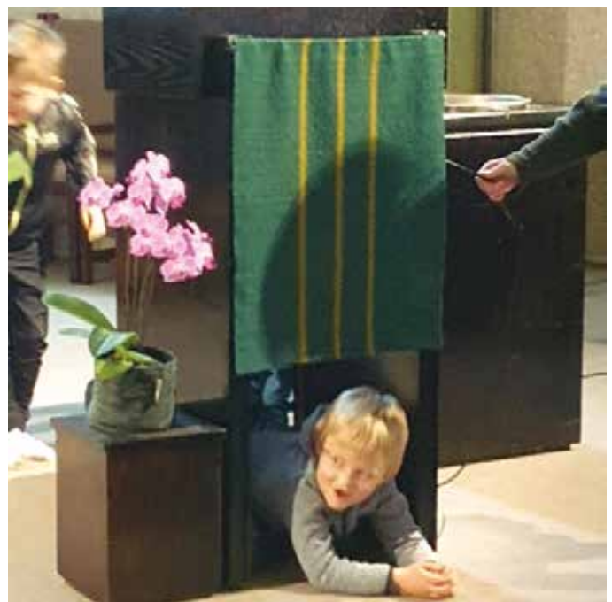
Her leker en kirkerotte at han sitter fast i orgelet.