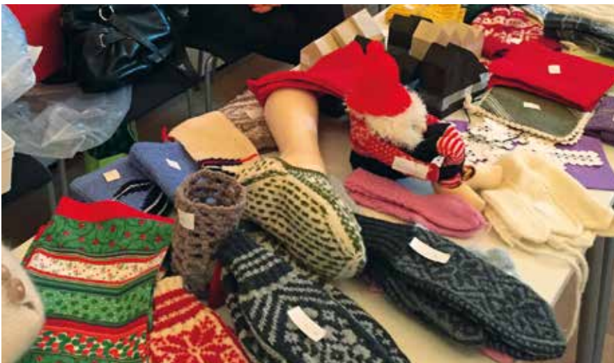
Mye flott å kjøpe på julemessa.

Jesus deler fortsatt i overflod fra sitt rike. Det Jesus gir overgår våre forventninger. Han snakker om livet, om lyset, om sannheten og evig liv. Den virkeligheten han kommer med klarer vi ikke engang å begripe i mer enn små glimt om gangen. Denne virkeligheten inviterer Jesus oss inn i og sier «følg meg.» Han vil at vi skal bli kjent med ham og dele hans overflod med andre.