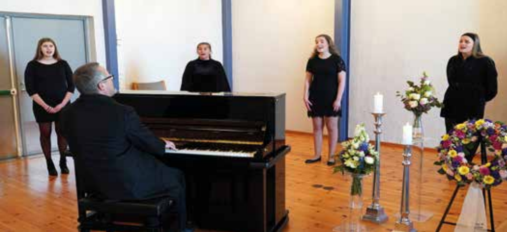
Begravelse i korona-tiden oppleves ekstra tungt. Her synger fire jenter fra Ungdomskoret GG, med en meters avstand men likevel nydelig tilstedeværelse.

savner fellesskapet, det å møtes uformelt uten å være redde. Vi trenger å møtes for å merke at fellesskapet lever.