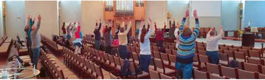
Gand kirkekor kunne samles, med ekstra stor avstand.

siden vi har blitt fratatt så mange andre typer fellesskap.