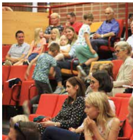
God stemning på gudstjenesten på Lundehaugen skole.