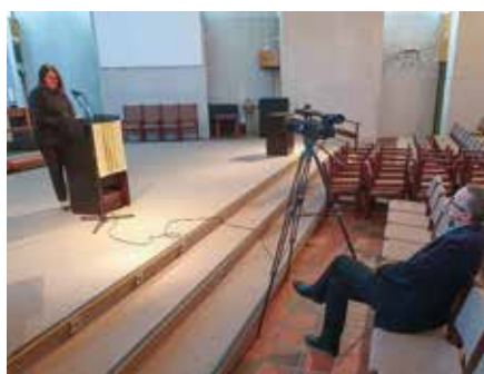
Digitale andakter ble spilt inn til påsken.

Sommer og høst 2020 forløp nesten som normalt, men vinteren og våren 2021 har det vært mange nedstengninger. For meg har fokus vært å sikre at det var gudstjenester hver eneste søndag, selv om menigheten ikke kunne være fysisk til stede i kirken.»