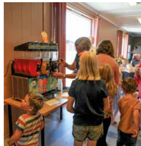
Slushmaskinen var populær.