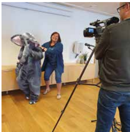
Innspeiling av digital Babysang-samling.

I menighetsblad nr 3 i 2020 hadde vi to reportasjer om hva vi gleder oss til etter pandemien er over, og hvordan pandemien hadde påvirket arbeidet i menigheten fra påsken og utover sommeren.