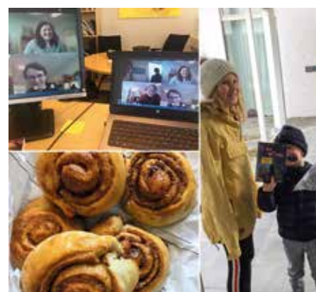
To snille kirkenaboer kom med nystekte boller til de få som var på kontoret. De aller fleste i staben var på hjemmekontor, og møtene tok vi på Teams.

Vi har også hatt et relativt høyt antall enkeltgudstjenester med dåp, både av babyer og av kommende konfirmanter. Dette har vært fine stunder med ekstra fokus på selve dåpshandlingen. Når det er så få tilstede, blir nærheten desto større, og det har gitt dåpsfamiliene og meg som prest noen rike og meningsfulle opplevelser.»