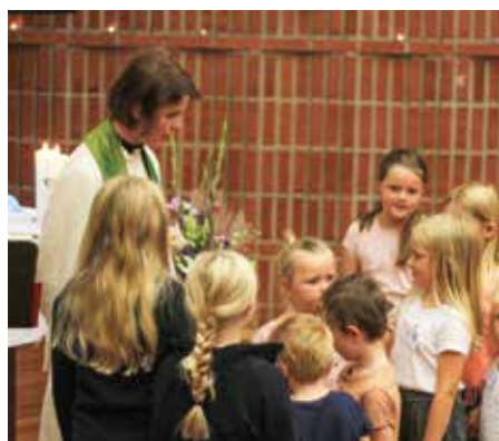
Mange barn ville kikke oppi skattekista.

Ved menighets-senteret var det samlet over 150 personer ute og inne, og det kjekkeste var at det var så mange nye! Det er alltid ekstra hyggelig å kunne gi et varmt og hyggelig første møte med menigheten.