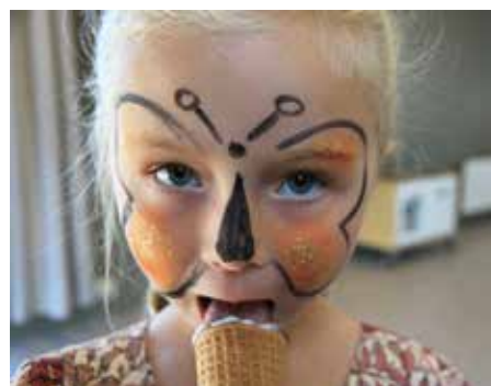
Is og ansiktsmaling - Blir det bedre.