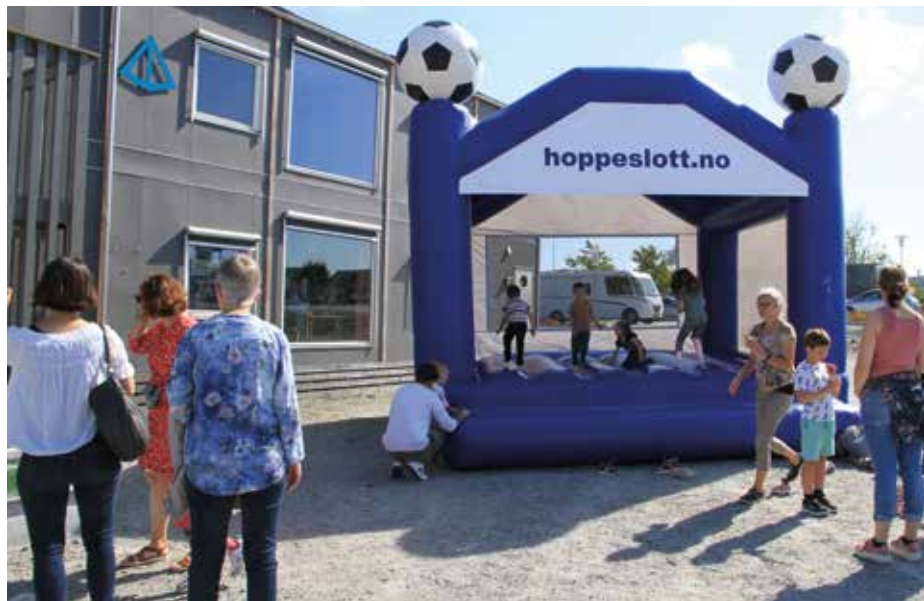
Vi hopper inn i et nytt semester.