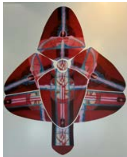
Kunstverk: Per Odd Aarrestad

Denne våren har vi hatt 2 samlinger med tema «kjærlighetens 5 språk» hvor en hadde en kveld med tema foreldre barn og den andre samlingen hadde tema parforholdet. I tillegg til selve foredraget har det vært anledning til å stille spørsmål til foredragsholderne som var med på å gjøre kveldene både givende og underholdende. Det har vært en enkel servering på samlingene og det er ingen inngangspenger. Samlingene har vært godt besøkt med rundt 40 deltakere på hvert foredrag. Til høsten er det planlagt 3 nye samlinger.