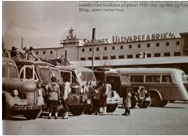
Av Asbjørn Sørbø

Da Sandnes feiret 150 år som by i 2010, ble det laget en grønn park. Samtidig kunne folk skrive sine ønsker for Ruten på «gule lapper», som ble hengt opp i en av undergangene. De fleste ønsket at parken skulle bli værende. Slik gikk det ikke, men ting var på gang. Det ble lyst ut arkitektkonkurranse, og vinnerutkastet kan du se nå: En lysende ring på hvite søyler over et spennende område.