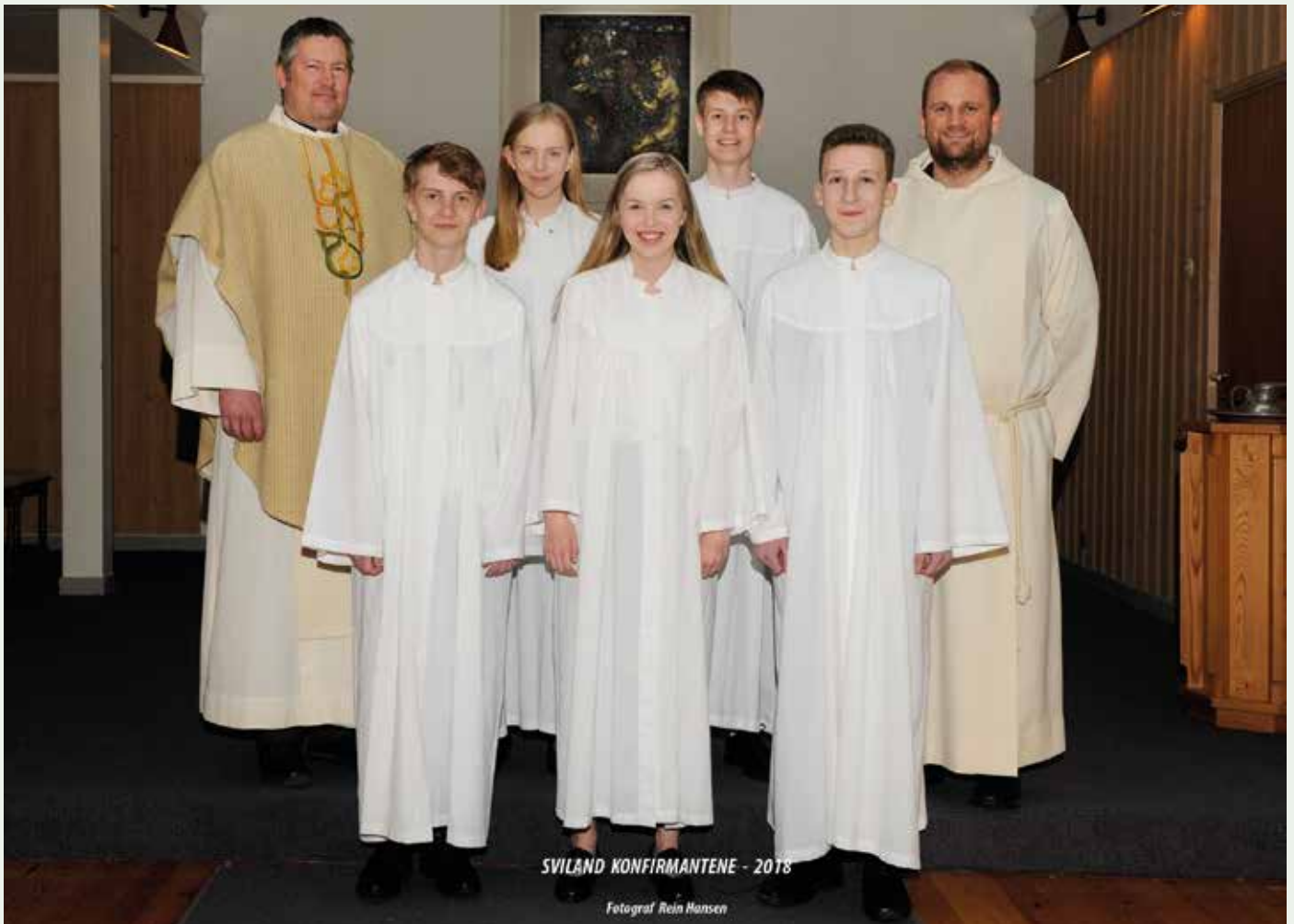
SVILAND KONFIRMANTENE - 2018