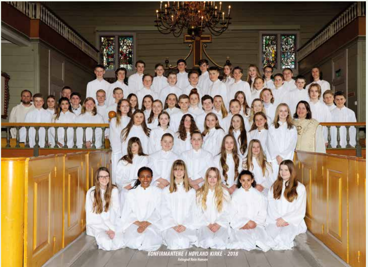
KONFIRMANTENE I HØYLAND KIRKE - 2018