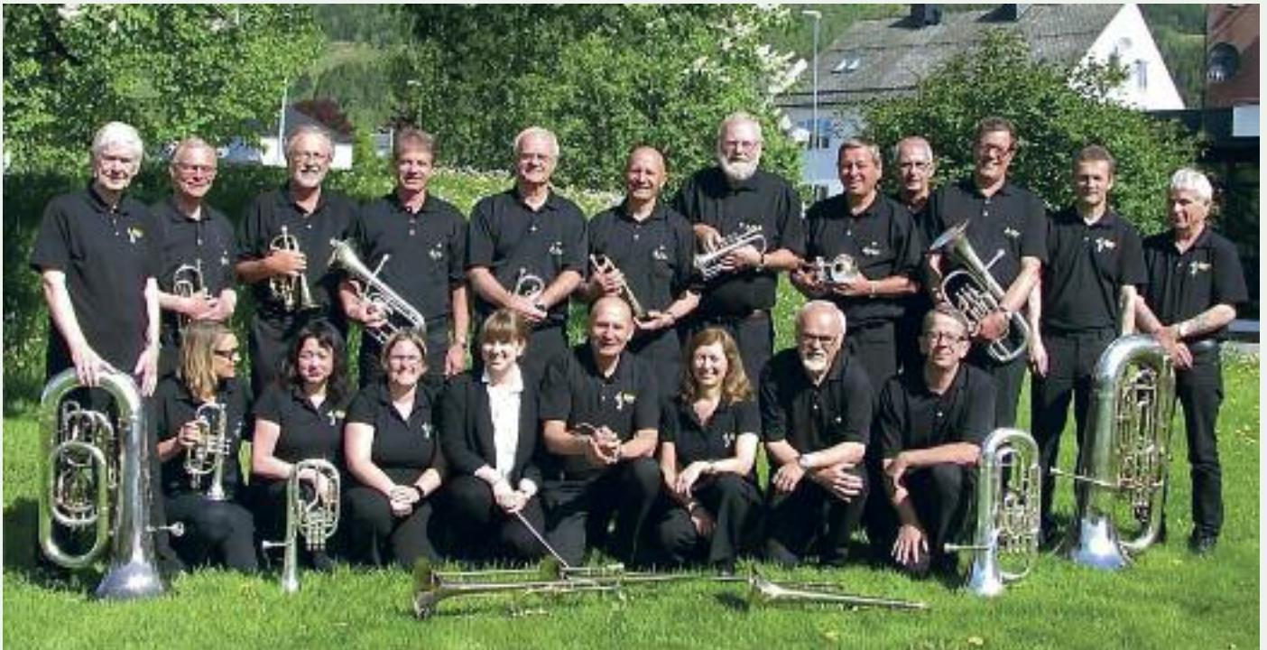
Elim Brass , et av de mest aktive korpserne i Sandnes.