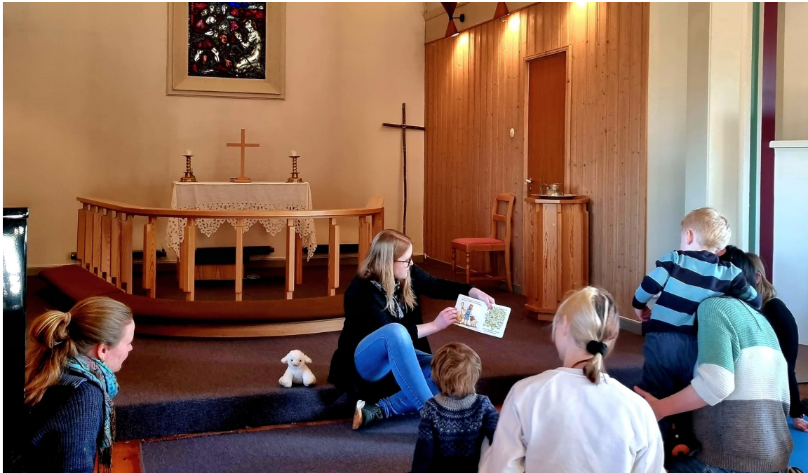
Krøllesamling i Sviland kyrkje for 2- og 3- åringar