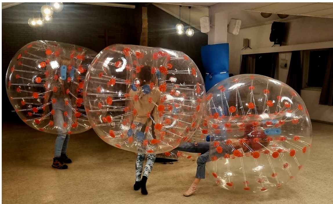
Lek med zorbballer på menighetshuset under Lys Våken i Høyland kirke