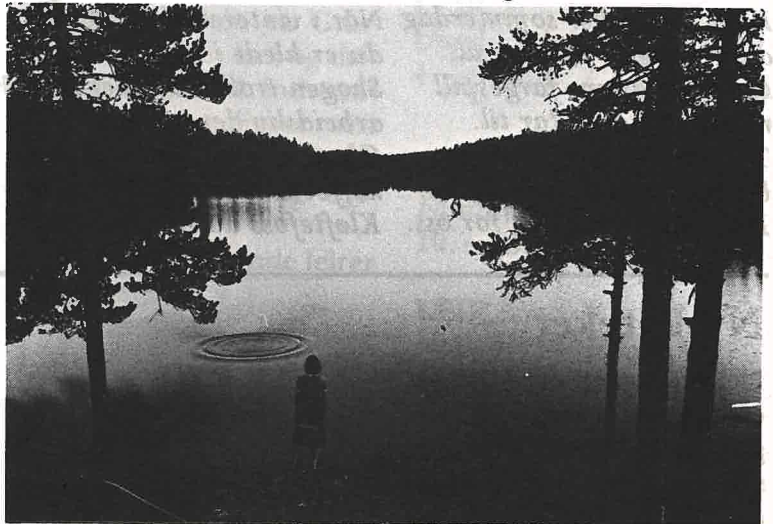
Der er idyllisk inne ved Sandungen. Det er til denne odden nord i vannet at vi skal ha utflukten vår.

Snarum menighet vil også i år dra på tur. Vi reiser ikke land og strand rundt, men finer oss heller en fin plass i vår egen bygd. I år blir det inne ved Sandungen i Holleia. I nordenden av vannet stikker det ut en fin holme, som det er fint å sitte på og bade fra. Der blir det friluftsgudstjeneste, allsang og kaffekos. Så ta med kaffe og mat og