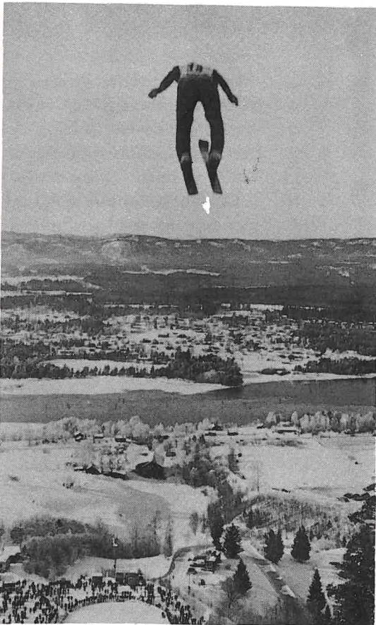
Der var mange luftige svev over Modums fagre bygder.

Vikersund idrettsforening satset høyt i år, og vant stort. De hadde mye motgang, og manglet snø helt til rett før rennet skulle begynne. Men de gav ikke opp, de stod på, og aldri har vel suksessen vært større. Det var et knirkefritt arrangement, og de gjør bygda vår kjent langt utenfor landets grenser. Vi kan ikke annet enn å uttrykke vår beundring for denne kjempeinnsatsen: GRATULERER V.I.F.