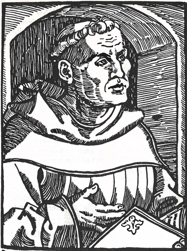
Doctor Martin Luther 1520

om evangeliet. Hans livsverk var å gjenopplage det personlige forholdet mellom Kristus og den troende, der det bare er nåden alene, troen alene og Skriften alene som gjelder.