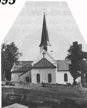
Heggen kirke var bare en liten steinkirke på 1500 tallet

I 1595 kom han med sitt følge på visitas til Modum. Biskopen hadde reist fra Oslo 1. juli kl. 5 om morgenen, og