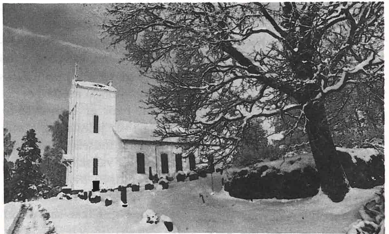
På 1. juledag drog de til kirken.

Juledags morgen var alle tidlig oppe. Først en deilig frokost med hvetekake, lefsekling med rakfisk og flere slag godt pålegg. Etter frokosten gjorde mor og far seg ferdig til kirketur. Jeg fikk også være med. Blakka fikk