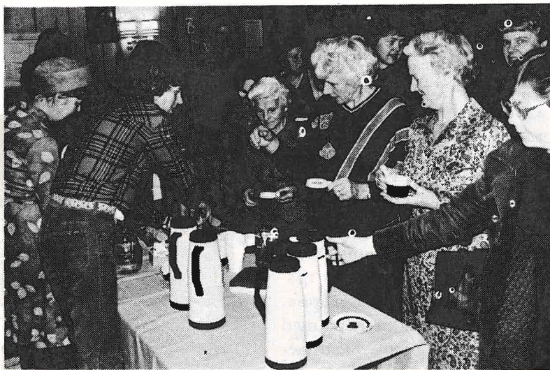
Det er ofte kirkekaffe etter gudstjenesten, som her på Menighetssettret. Det er oftest Heggen diakonat som stiller den i stand. Mange setter stor pris på å være litt sammen etter gudstjenesten for å få en prat.