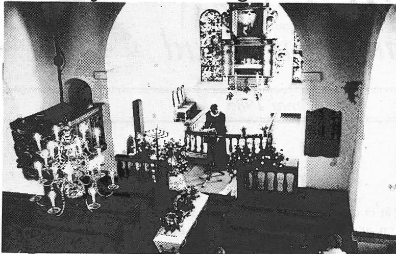
Visste du at bisettelse til kremasjon kan foregå i bygdas egne kirker?

På Modum som i de fleste landdistrikter i Norge foregår de fleste begravelser på den gamle måten. Kisten legges i grav på kirkegården. Bare 10–12 % skjer som kremasjon. I mang byer er det omvendt. Der blir de flest døde kremert. Bisettelsen foregår i kapellet på krematoriet.