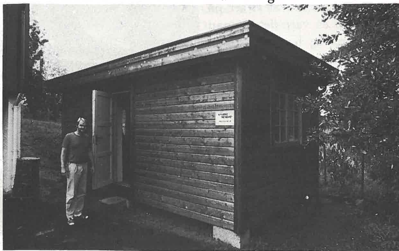
Slik ser det nye prestekontoret på Åmot ut. Det ligger vegg i vegg ved boligen til den residerende kapellan i Doktorveien. Kontoret er blitt praktisk og greitt, og innvendig er det også vakkert og koselig. Det er godt å ha en snekkerkyndig prest i bygda.