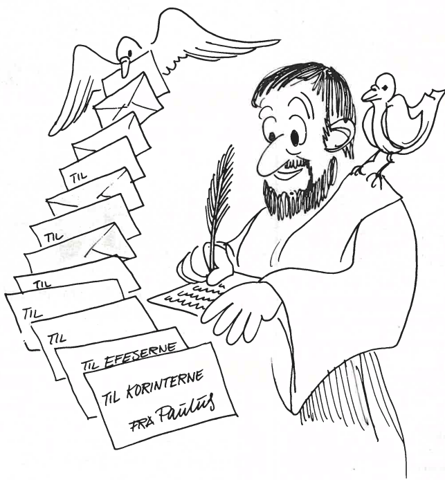
Paulus var en flittig brevskriver.