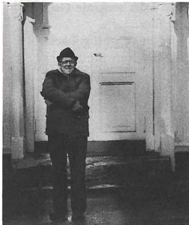
Blir det kalde kirker i Modum denne vinteren?

Det er likevel klart at kirkene ikke vil ha den samme behagelige oppvarming i benkene som vi er vant med. Det kan bli nødvendig å sitte med yttertøyet på under gudstjenesten.