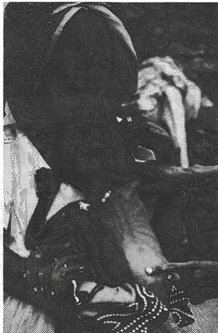
En av de mange eritreiske mødrene som har fått hjelp til å hjelpe sin lille datter.

folkningen å drive med jordbruk. Her har Kirkens Nødhjelp i flere år drevet et omfattende hjelpearbeid. I år tar vi sikte på å formidle hjelp for mer enn 20 mill kroner inn til Eritrea og Tigray.