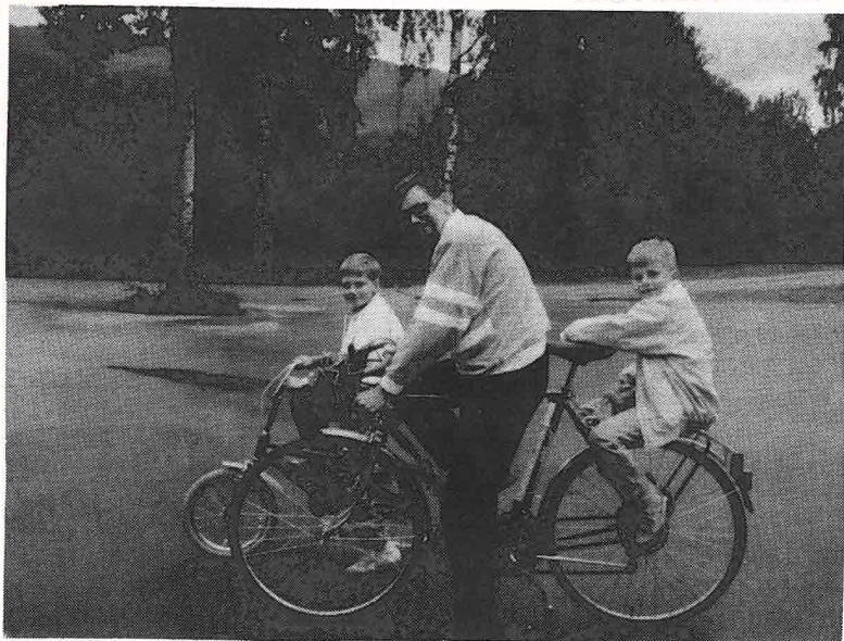
Blir «Kirkesykkelen» skyssen til gudstjenesten heretter?

Mange bruker en sommersøndag til å ta en sykkeltur. Søndag 13. august ønsker vi at riktig mange skal sykle til Heggen kirke og være med på gudstjenesten. Denne søndagen vil menigheten rette oppmerksomheten mot ansvaret for naturen og miljøet. Det blir appell ved Natur og