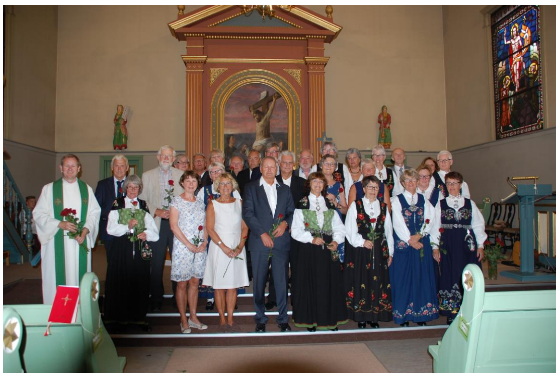
Fra gudstjeneste der 50-års konfirmentene i 2018 deltok.