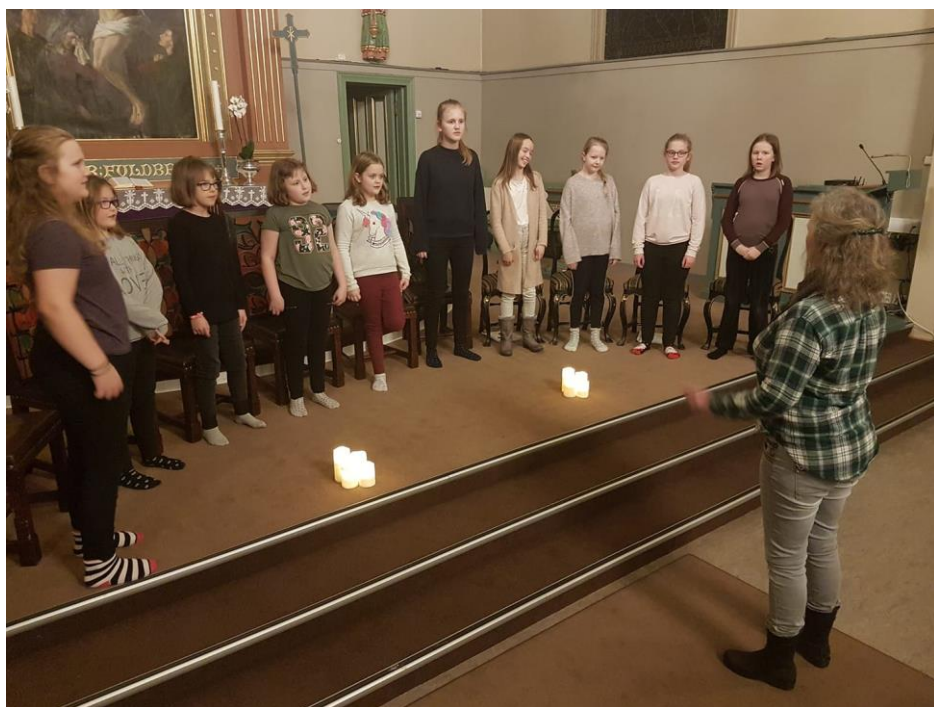
Fra en øvelse med jentekoret i desember 2018. Vi tar gjerne imot flere som vil være med å synge i kor.

AKJ har god plass til flere medlemmer, og vi ønsker alle jenter som liker å synge og som er nysgjerrig på å utvikle seg selv og sangstemmen sin hjertelig velkommen.