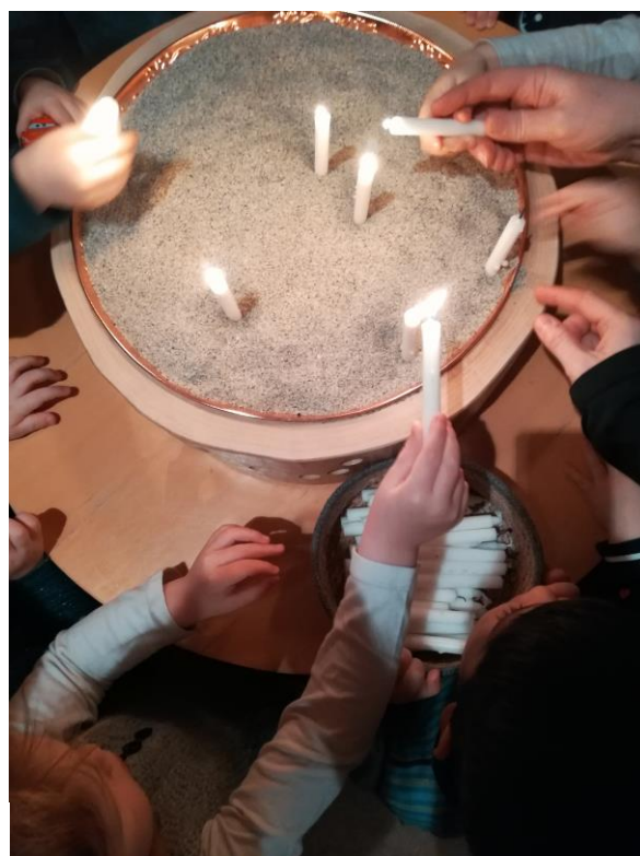
Bilde fra lystenning på småbarnssang.