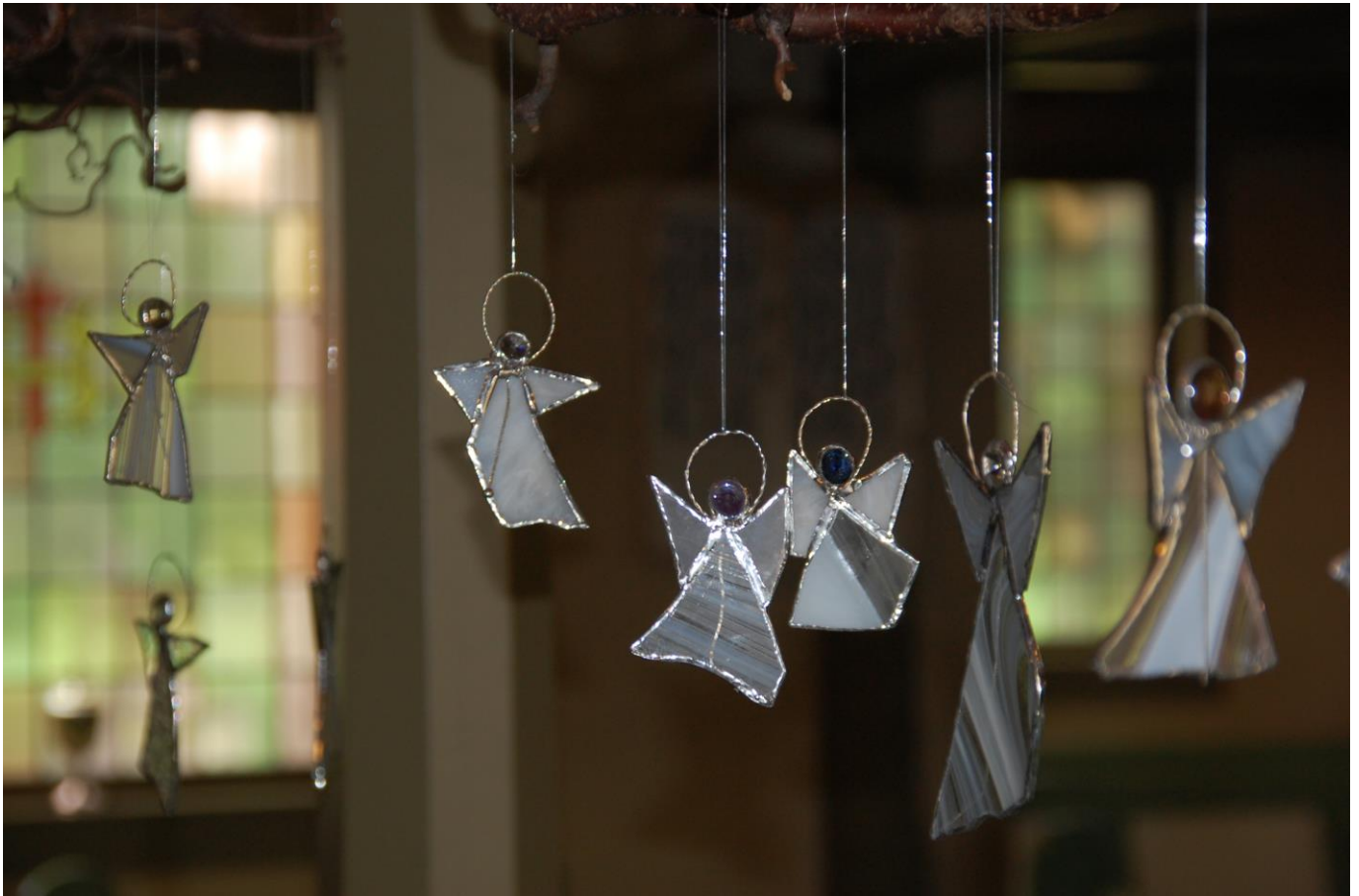
Bilde av englene som gis til dåpsbarna. Englene blir hengt opp i kirken på dåpsdagen og kan hentes på en egen «hente engel samling» i kirken senere.

Tirsdag og onsdag i uke 50 hadde vi julegudstjeneste for barnehagene. Barn fra Rom barnehage og Espira Skolegata barnehage kledde seg ut og var en del av juleevangeliet som ble formidlet. I år var det ca.250 barn tilstede.