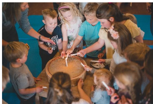
Lystening på Småbarnssang.