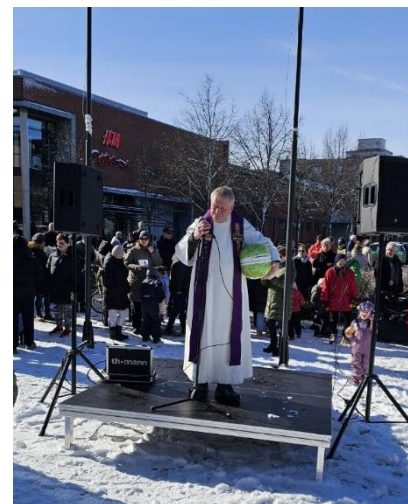
Utegudstjeneste på Påskeeggjakten.

Gode naboer har bl.a. samarbeidet om det følgende: en årlig Hagefest for barnefamilier siden 2018; Vinterfest og Påskeeggjakt med andaktsinnslag fra Askim menighet og musikk fra Frelsesarmeen; Julegaveaksjonen Juletre med mening startet i 2018, siden spredd til andre deler av storkommunen; Halloweenfering i Folkeparken; opprettelsen Våketjenesten i Askim i 2019; diverse andre mindre prosjekter.