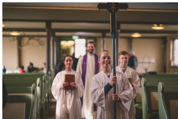
Ministranter i prosesjon i kirken.