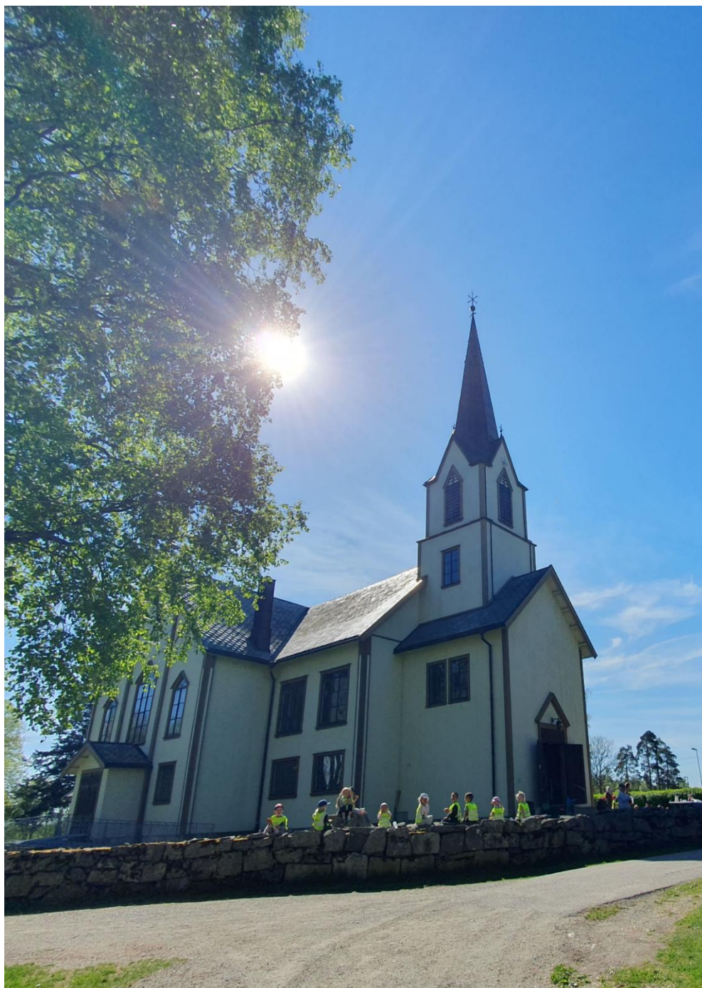
Barnehagebarn utenfor Askim kirke etter pinsefest.