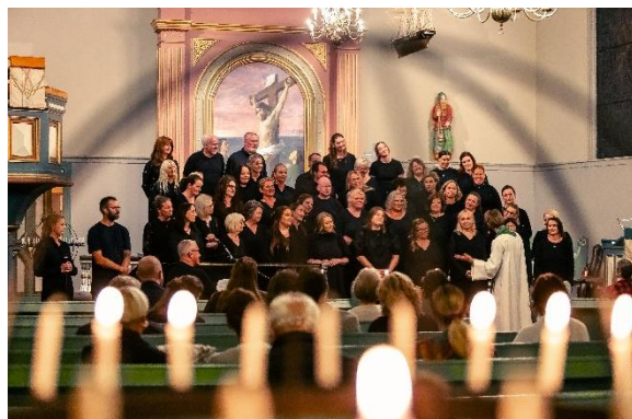
Sang av Indre Østfold Gospel Company på G2 Lovsangsmesse.

Askim menighet har et variert musikkliv. I gudstjenestene er det variasjon mellom orgel og piano, samt moderne musikk med lovsangspreg på kveldsgudstjenestene G2 Lovsangsmesse. Det er også en del samarbeid med andre musikalske aktører i byen, bl.a. synger Normisjons KorX jevnlig på gudstjenester, og ulike aktører holder konserter i kirken. En av våre musikalske høydepunkter er den årlige «tradisjonelle julekonserten» i Askim kirke, hvor korene i