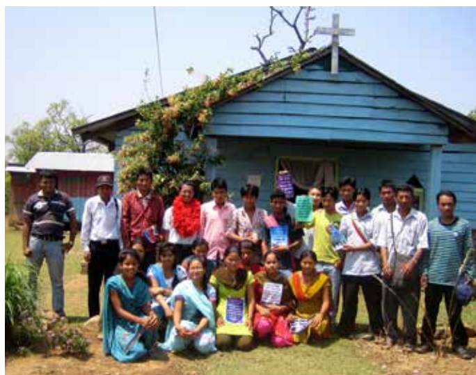
Menighetskurs på landsbygda i Nepal

Misjonsprosjektet til HIMALPARTNER vil fokusere på Bethesda