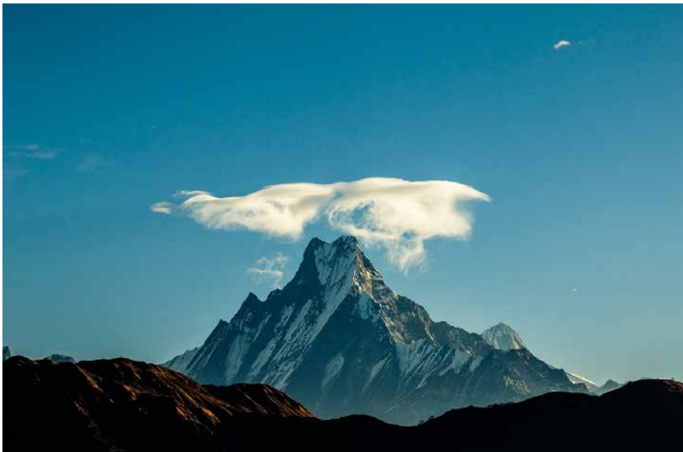
En av de mest karakteristiske fjelltoppene i Nepal er Machhapuchare

Mellom India og Kina ligger fjellandet Nepal som på sanskrit betyr «ved foten av gudenes bolig». Hovedfokus i det nye misjonsprosjektet er på Nepal der både Normisjon og HimalPartner har arbeid som delvis er sammenfallende. De midlene som samles inn i Askim går generelt til organisasjonenes arbeid. Askim ønsker å fokusere på ABBS og Bethesda.