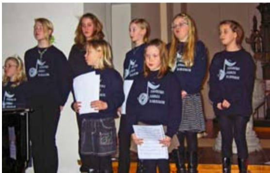
Eidsberg kirkes barnekor deltok med fin sang