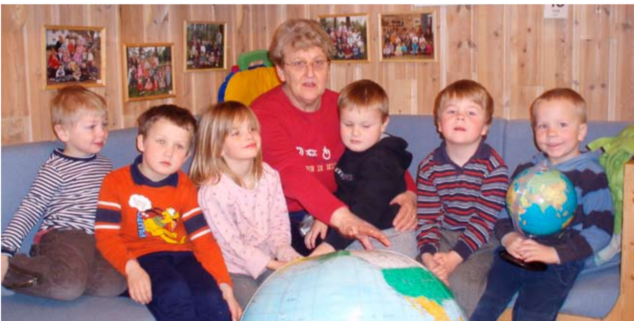
Styrer i Menighetens Barnehage viser hvor Egypt ligger