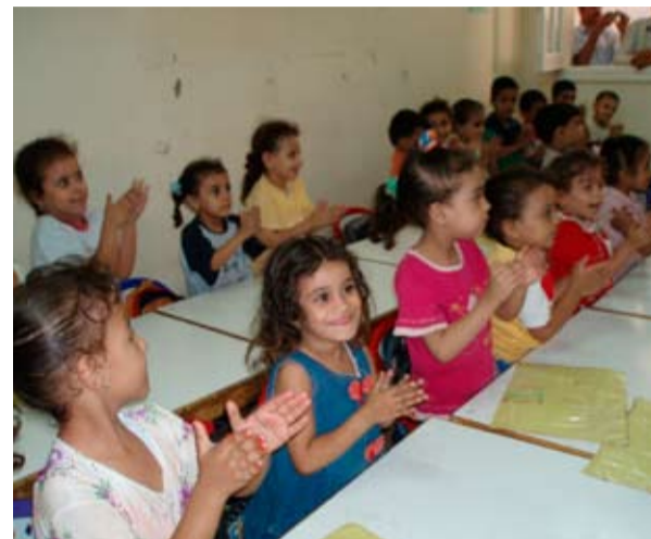
Glade barn på skolebenken