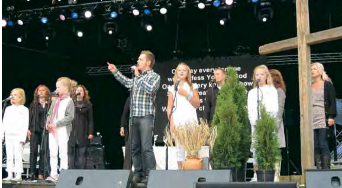
Sammen: Både barn og voksne stod på scenen og ledet allsangen under gudstjenesten på Momarkedet.