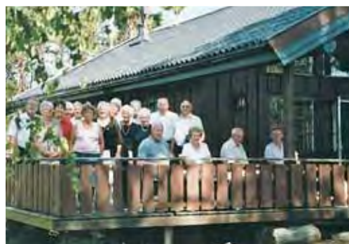
Hyggetreff på søndagsskolehytta. Pensjonistkoret fra Rakkestad og trømborginger på verandaen.