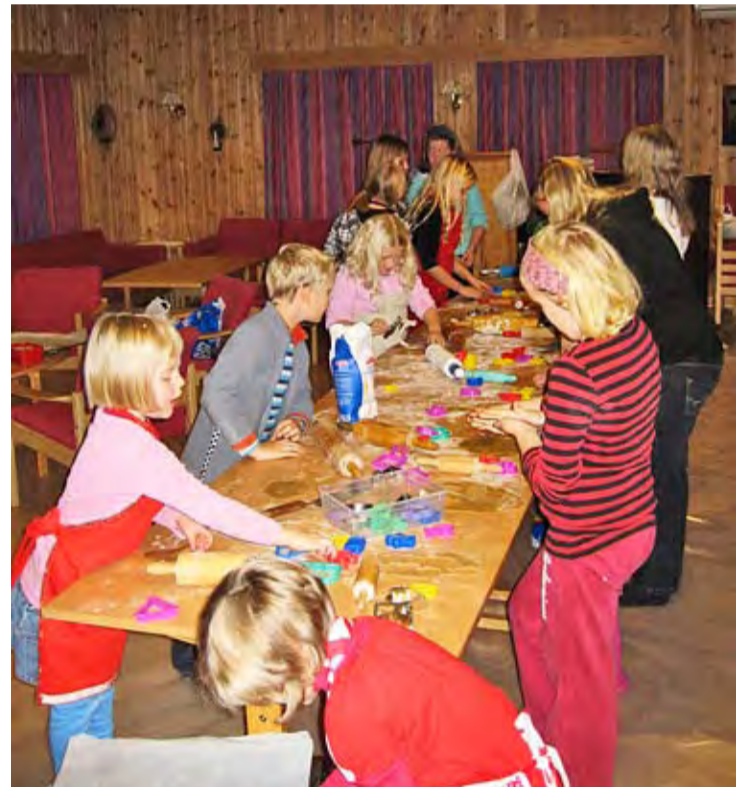
Fra Trømborg: 60 barn og 29 voksne møtte opp på juleverksted på Menighetshuset i Trømborg i regi av Mandagsklubben og trosopplæringen. Det ble servert grøt og barna fikk være med på 4 forskjellige formingsaktiviteter: Lage kalender, engler, bake pepperkaker og forbereder til adventsgudstjeneste med tegninger og julekrybbe. Her et bilde fra langbordet med pepperkakebaking.

Det har vært adventssamlinger i alle fire kirkene, som en forberedelse til adventsgudstjenestene. Her er noen bilder fra de forskjellige stedene: