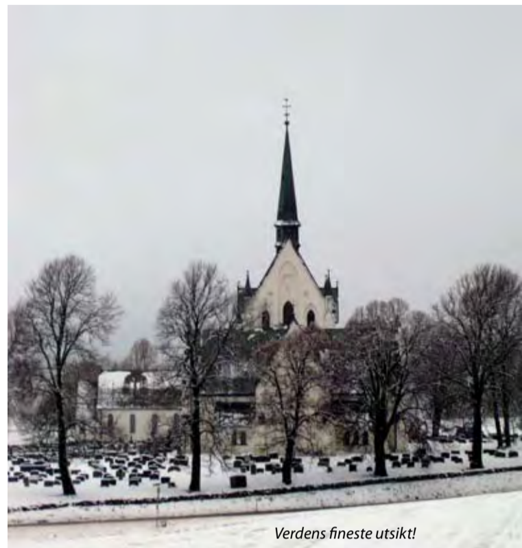
Verdens fineste utsikt!

Velsignet jul! Godt år med nåde og fred!