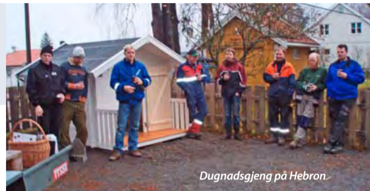
Dugnadsgjeng på Hebron

Nå har vi fått lekestue på Hebron, og ungene koser seg. Mye lek og moro rundt og i den. Her er gjengen som var med og sette den på plass.