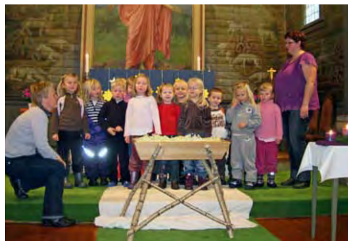
Øverst til høyre: Juleevangeliet ble dramatisert av barn fra Høytorp Forts barnehage.