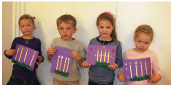
Fra Mysen: Formingsaktiviteten var å lage adventsbilde. Her vises 4 fine bilder frem.