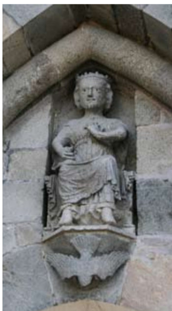
Eidsberg kirke er viet til Olav den hellige.