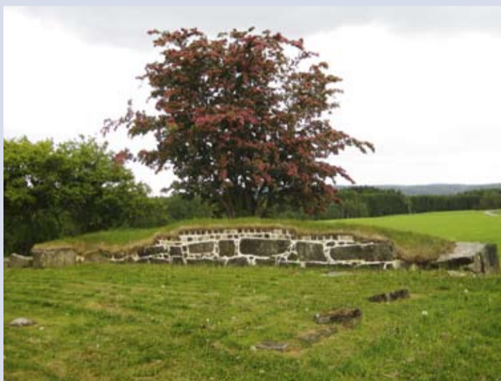
Friluftsgudstjeneste på Tenor kirkeruin søndag 16. august kan kombineres med en rundtur på Slitu med buss og til fots hvor man får guiding om eldre og nyere kulturminner som rettersted, første automatiske telefonsentral og ikke minst Tenor kirkeruin.

Velsignet sommertid og vel møtt til gudstjenestefeiring her i Eidsberg kommune!