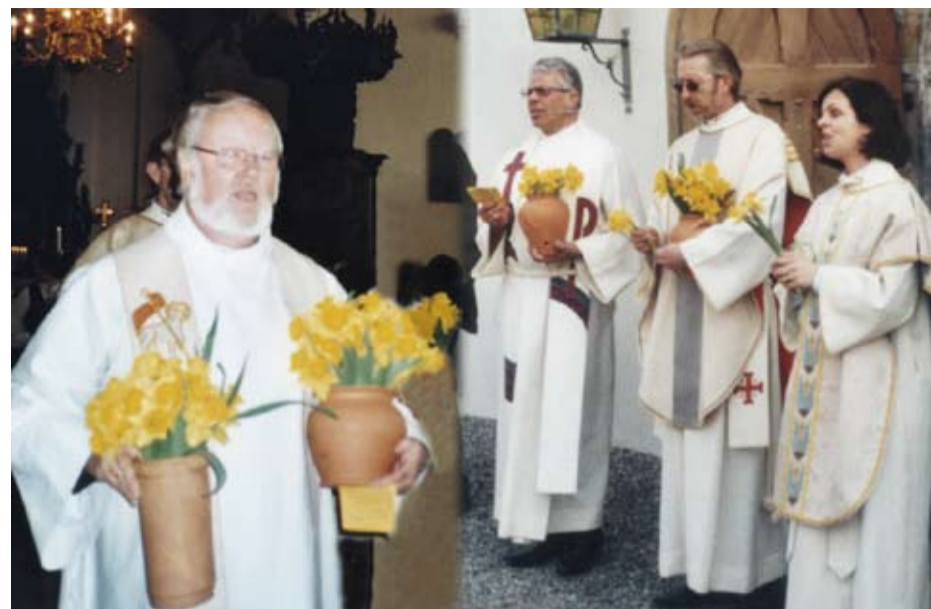
Prestene delte ut påskeliljer 1. påskedag til menigheten etter utgangsprosjesjon

Påskan i år ble en fin opplevelse med felles gudstjenester i Eidsberg kirke. Mange i sognet har uttrykt glede over å oppleve fellesskapet på denne måten.