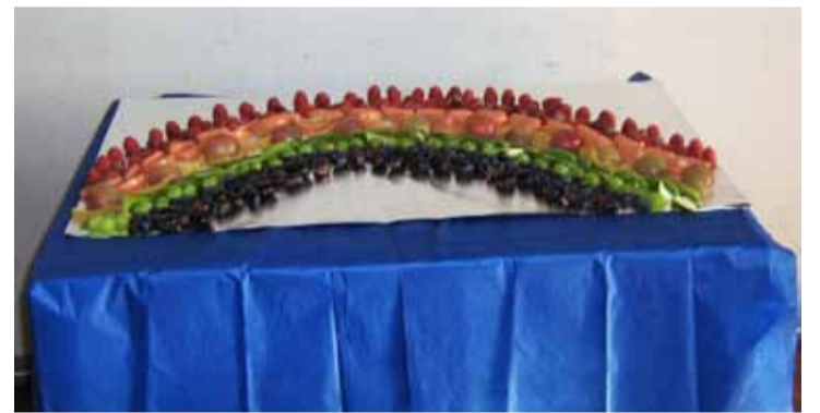
Menigheten fikk smake på regnbuen

Høsttakkefestene er en fin ramme rundt dette tiltaket, og Bygdekvinnelagene bidrar til at dette blir markert på en fin måte. I Eidsberg kirke fikk menigheten anledning til å «smake på regnbuen» under gudstjenesten.