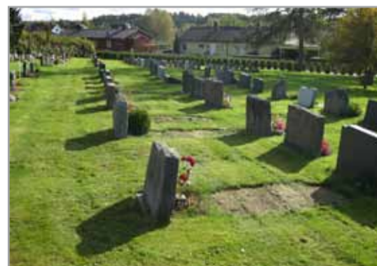
Mysen nye kirkegård

Dette er et ganske omfattende arbeid som vi har liten tid til i et travelt sommerhalvåret. Vi ber derfor om forståelse for at det kan se litt "halvferdig" ut i vinter, - forhåpentlig får vi et fint snødekke som skjuler den tilkjørte jordmassen.