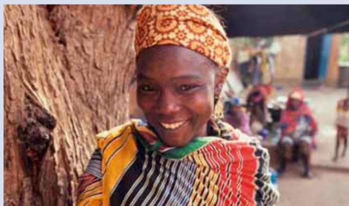
CARE hjelper kvinner fordi det er den mest effektive formen for bistand.

Care har erfart at hjelp til kvinner er den mest effektive måten å drive bistand på. Om en kvinne får hjelp og øker sin inntekt er det ikke bare hun som får hjelp. Tall fra Verdensbanken viser at når en fattig kvinne får økt inntekt, går 90% til familien, mens en