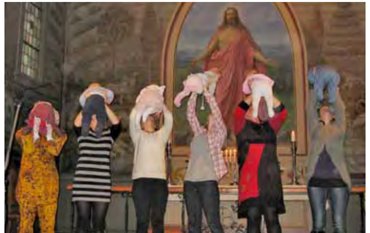
Barn og foreldre fra Babysangen framfører sang med bevegelser.

Det som gjorde denne gudstjenesten spesiell var alle barnesangene og hovedtema: Kardemommeby og Hakkebakkeskogen. Begge er kjente steder fra Egners barnebøker og dannet grunnlag for preken. Selv barnebøker kan gi mye visdom. Bakemester Harepus i Hakkebakkeskogen sier for ek-