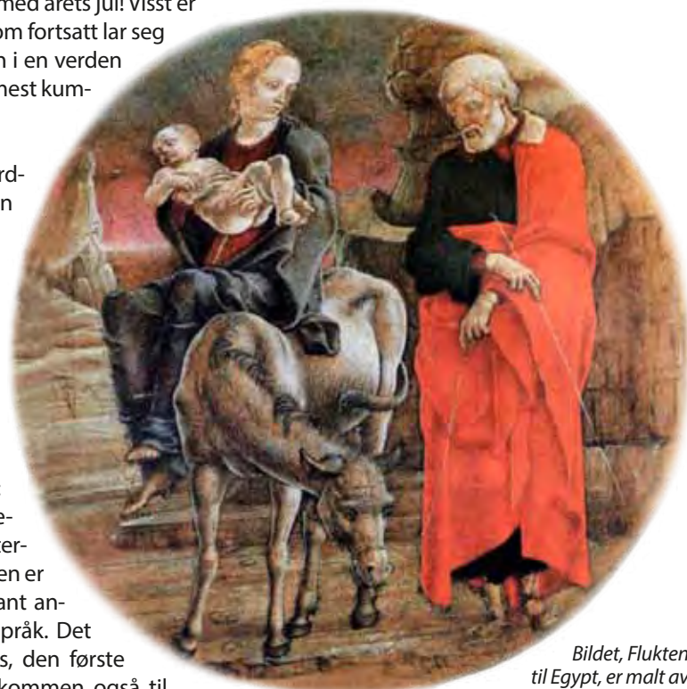
Bildet, Flukten til Egypt , er malt av italieneren Cosimo Tura ca 1475.

Beste hilsen Solfrid, sokneprest i Mysen og Eidsberg.