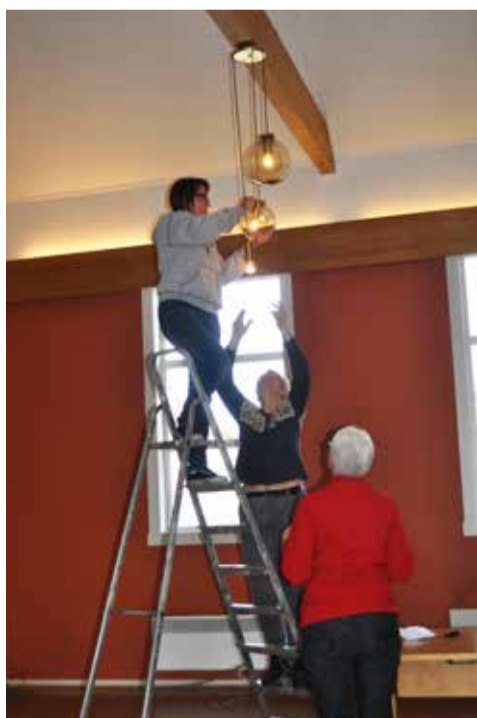
Inne var det damene som tok ansvar for å redde unna det som reddes kunne.