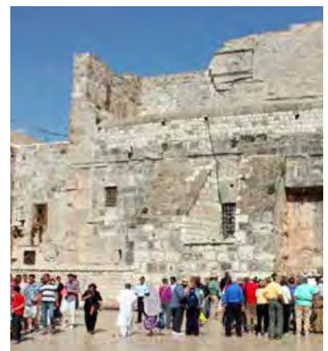
Fødselskirken i Betlehem.