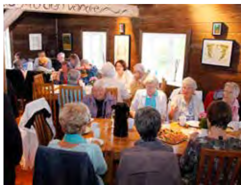
Peisestua var et hyggelig samlingssted hvor maten smakte godt.

Eplegården ligger i skråningen ned mot det vakre Drøbaksundet. I det vi svingte inn på tunet seilte Danskebåten forbi mot sine opplevelser. I Gransæthers orientering om denne flotte gården ble raet fra istiden en link mot Monaryggen og Mysen. Med jordsmonn av sand og stein lå det til rette for fruktdyrking da gårdsdriften ble lagt om. Vi fikk høre en engasjert gründer som har klart å skape et levebrød av most fra saftige epler som kjente restauranter i Oslo roper etter.