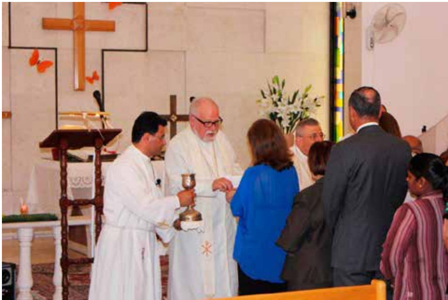
Nattverdsfeiring fra påskegudstjeneste i Amman.

I Amman fikk vi med oss påskegudstjenesten, (de ortodokses kalender er jo en litt annen enn vår, og lutheranerne følger den når det gjelder høytider) en flott opplevelse, selv om det meste foregikk på arabisk. «Kristus er sannelig oppstanden» lød høyt og klart på arabisk, minst 3 ganger under gudstjenesten, og liturgen for øvrig var lett å kjenne igjen. Etterpå var det kirkekaffe, og vi observerte at påskefeiringen i Jordan også inneholder egg og kyllinger.