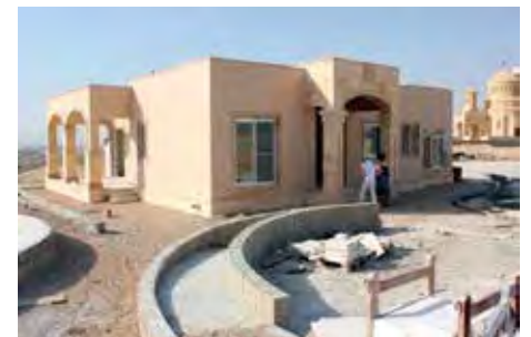
Luthersk kirke under oppføring.

reiser fra Norge til Det hellige Land, ikke bare besøker de vanlige turiststedene, men også kontakter de menighetene som fins, og for vår del er det da naturlig å besøke lutherske menigheter.