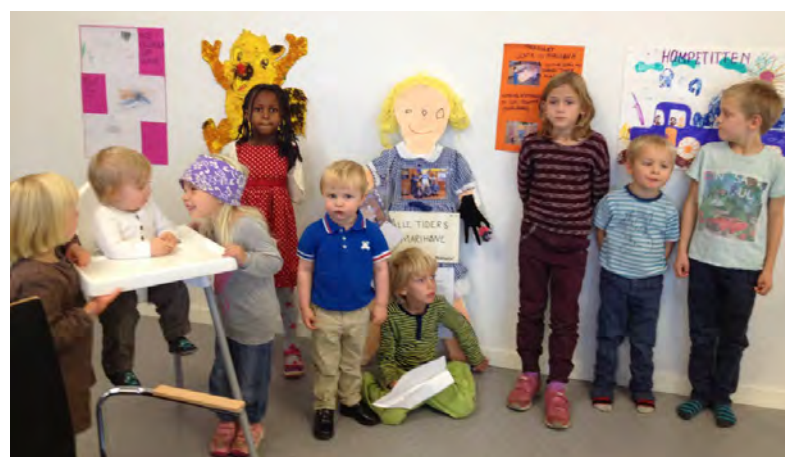
Glade barn foran Alf Prøysen-utstillingen lagd av Menighetens barnehage avd Hærland i forbindelse med Prøysengudstjenesten i Mysen kirke 9.nov.