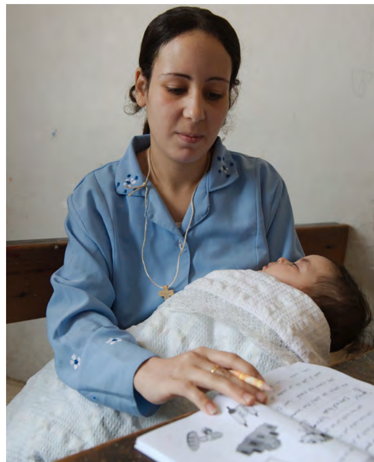
Sahar er 24 år gammel og har tre jenter. Både hun og mannen hennes kommer fra en landsby i nærheten av Minia i øvre Egypt.

Velsign oss, vær med oss, gi lys på vår vei, så alle kan samles i himlen hos deg!