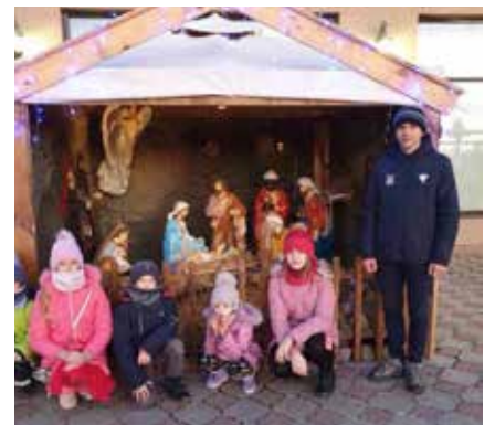
KRYBBE: Her er deler av familien foran en stor julekrybbe i Ukraina.