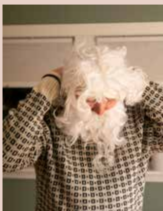
... et nisseskjegg...