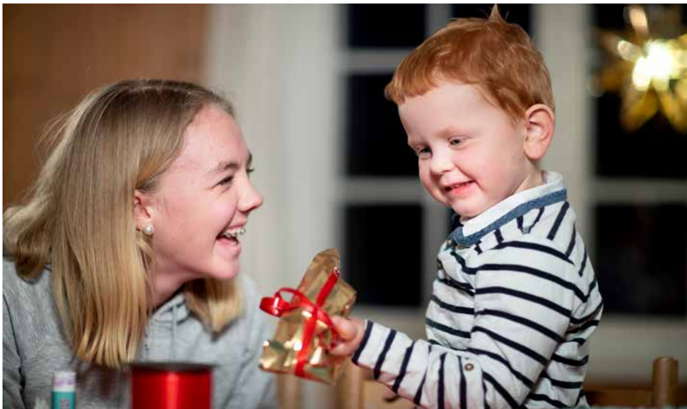
GODHET: "Måtte denne julen gi oss et glimt av Guds kjærlighet", skriver biskop Atle Sommerfeldt.