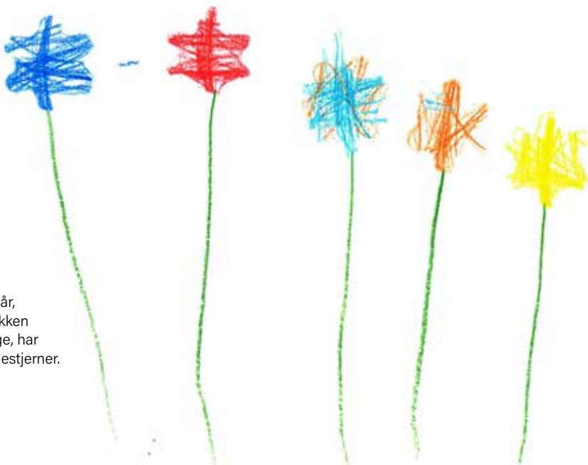
Iben, fire år, fra Solbakken barnehage, har tegnert julestjerner.