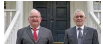
Bildet over: Denne gjengen var konfirmanter for 50, 60, 70 og 80 år siden. Bildet øverst til høyre: Konfirmanter for 51 år siden, midten: Konfirmanter for 61 år siden og nederst til høyre: To karer som sto konfirmant for 71 år siden.