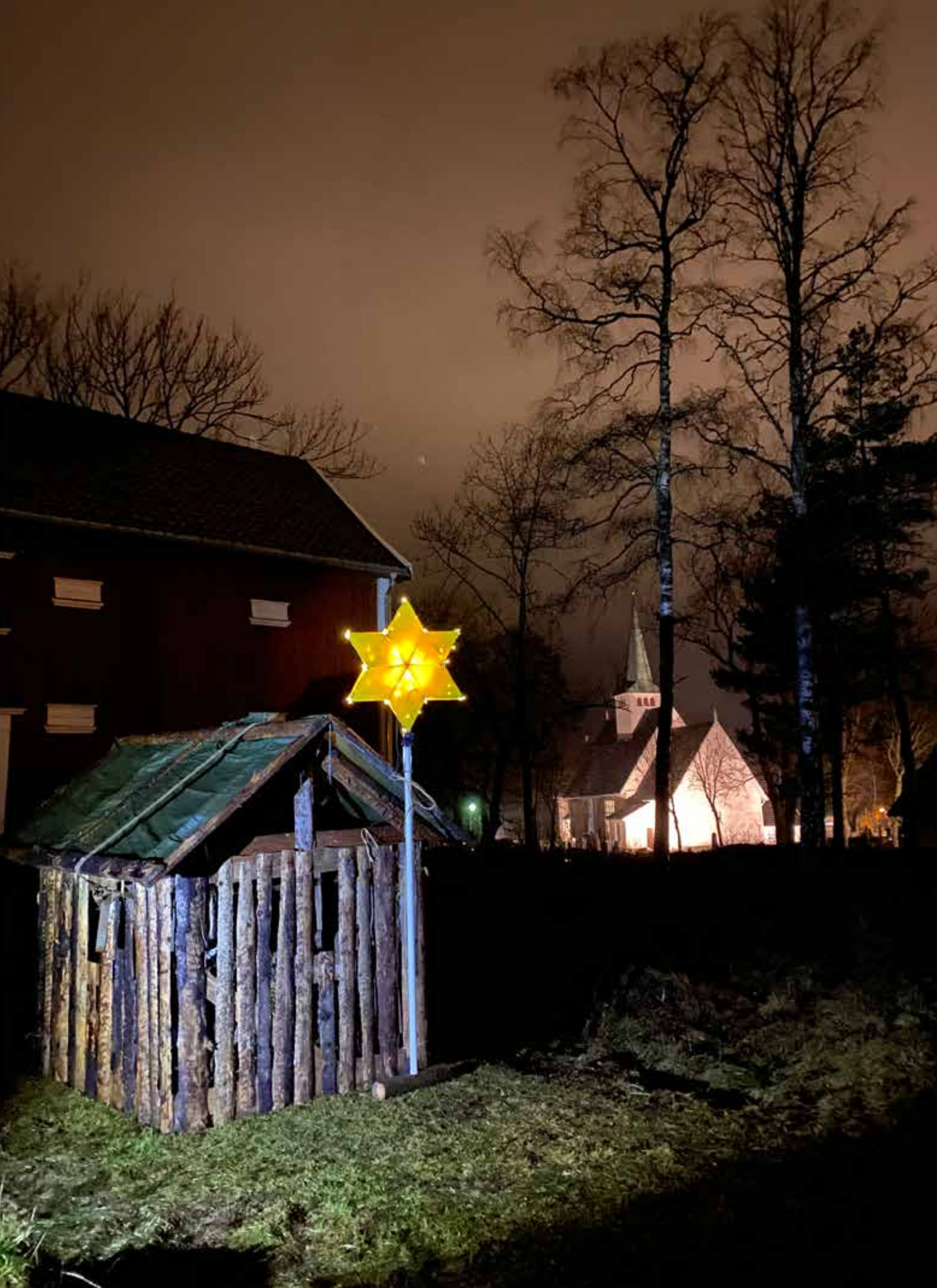
STALLEN: Et steinkast fra Trøgstad kirke ligger stallen. Den har vært i bruk siden 2009.