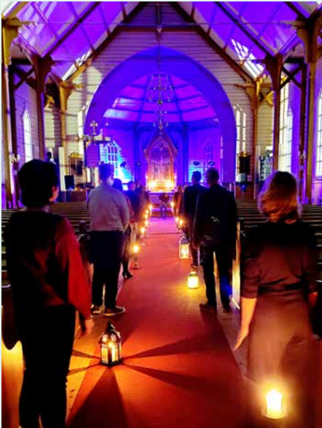
ER KULTURKIRKE: Flere aktører har bidratt økonomisk til at Hærland kirke nå kan kalle seg kulturkirke.