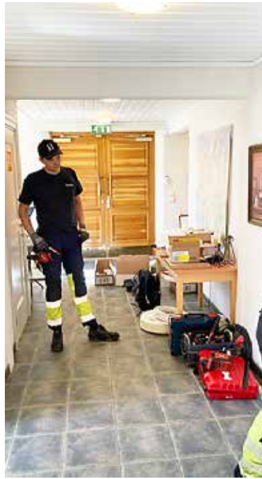
ALARM: Heli kirke er den nyeste kirken i Indre Østfold. Kirken har fått nytt alarmanlegg.