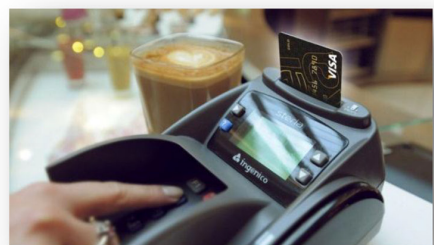
Betalingsformidling Debetkort og Kreditkort