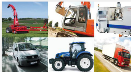
Lån og Leasing