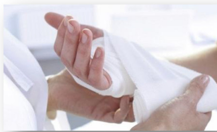
Person-, Skade- og Ulykkesforsikring