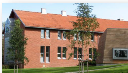
Din lokalbank for alle banktjenester