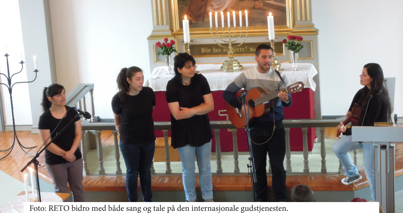
Foto: RETO bidro med både sang og tale på den internasjonale gudstjenesten.