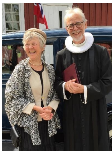
Prest og frue på vei til «Gammelteknisk»