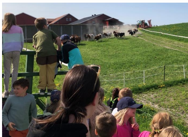
Kuslipp på Grav

Vi har avtale med «Trøgstadheimen» ved at barn og ansatte har faste treffpunkt på heimen der vi synger for og med de som bor der. Dette er stas for begge parter!