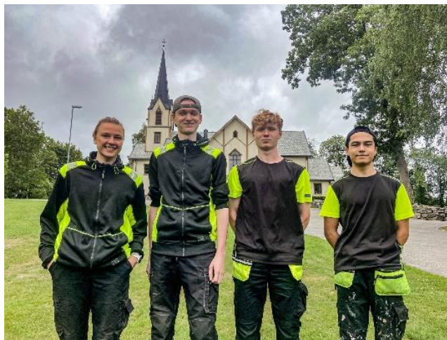
Blide sommervikarer utenfor Askim kirke.

Før sammenslåingen av fellesrådene i 2020 var det gjort en del prosjekteringsarbeid i forbindelse med å etablere Navnet og Anonym Minnelund i Trøgstad, prosjektering og utførelse ble startet opp i 2022 og anlegget ble overlevert og innviet 29. januar. Det er i alt gjort 5 gravlegginger på minnelunden ved utgangen av 2023.