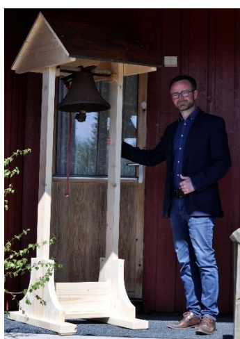
«Ny» klokke på Furuberget