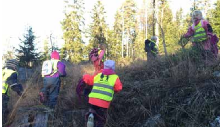
Maxibarna i Kirkestallen barnehage på tur for å bli naturvoktere.