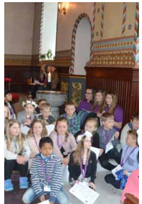
Bilder fra tårnagenthelg i Trøgstad kirke.