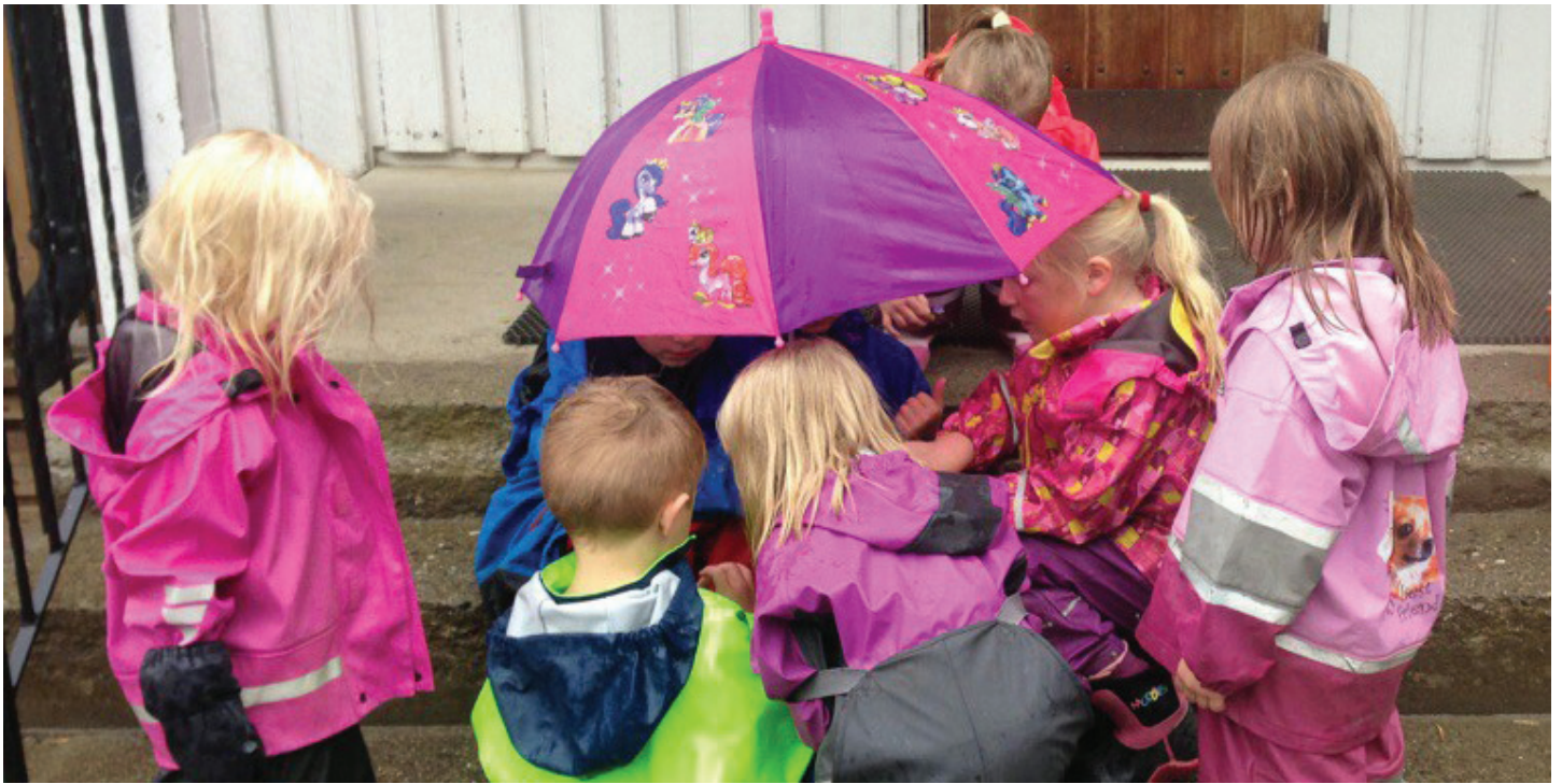
Her blir "pasienten" tatt godt hånd om.