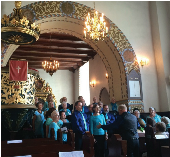
Sangkoret Ambolten i Trøgstad Kirke.