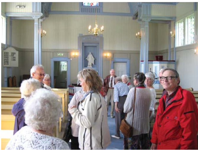
Omvisning i Dalen kapell