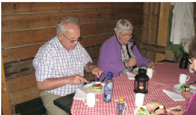
Gode gjeddekaker i restauranten