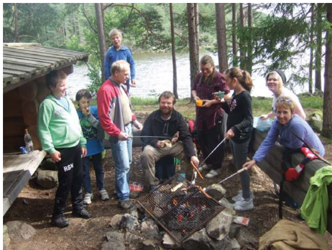
Tid for bålkos grilling av pølser