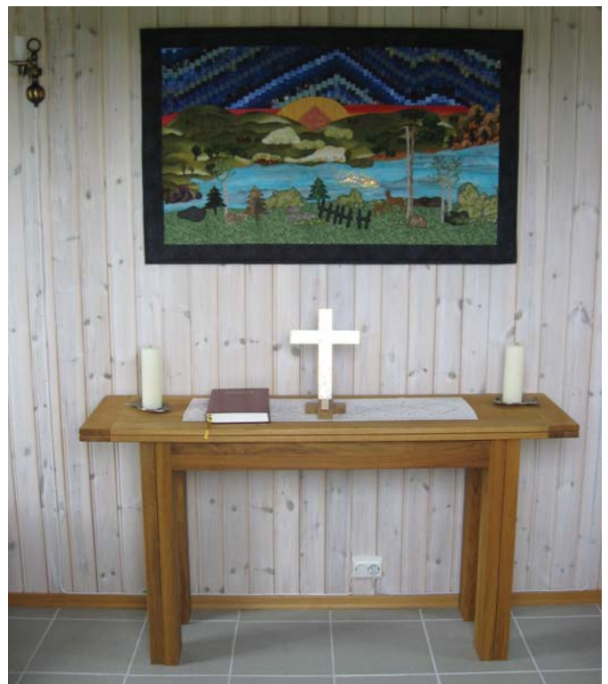
Andaktsrommet på Enebakkneset

Send oss gjerne tips om profiler i Båstad eller Trøgstad menigheter som du mener bladet bør intervjuer! Legg gjerne ved en begrunnelse hvorfor denne personen fortjener ekstra oppmerksomhet!