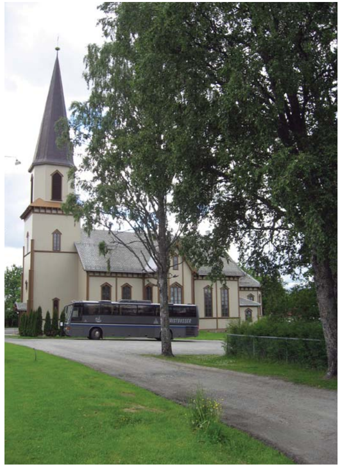
Fet kirke, nyoppusset i originale farger