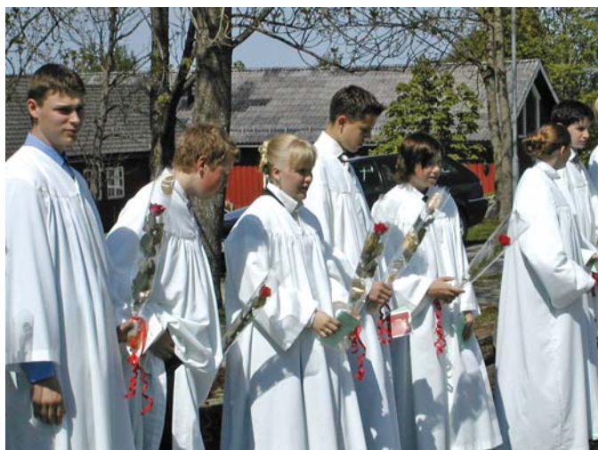
Utdeling av roser ved konfirmasjon 2011

Erfaringen fra i vår med én konfirmasjonsgudstjeneste lørdag og to søndag var udelt positiv. Gjennomsnittlig økte fram møtet per konfirmant fra 16 til 21 ved gudstjenestene. Til sammen deltok 828 personer ved de tre gudstjenestene, en økning på 30 % fra 2010.