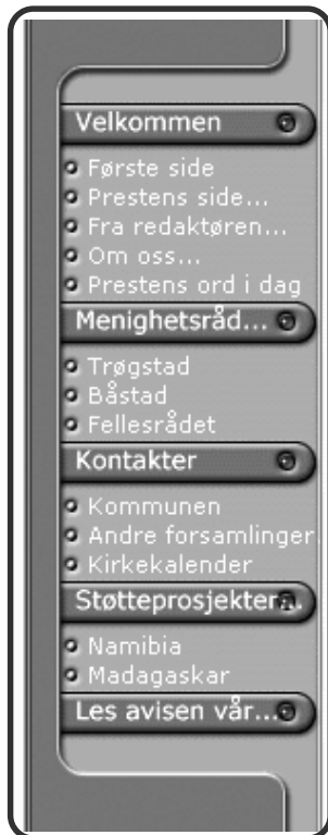
Her sees menyene... enkelt å "ta seg fram"

Kort sagt alt som ikke kan vente til neste nummer av Menighetsbladet. Det kommer på sikt å finnes musikk fra kirkene, og bare det å kunne lytte til "En sang jeg er glad i" gjør dette til et bra medium som skal fornyes med jevne mellomrom. Velkommen til et besøk der. Det beregnes være "på lufta" under februar på adressen: www.trokirk.no