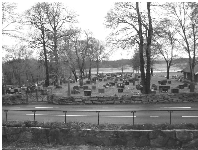
Fra kirkegården i Båstad Allehelgens dag 2005.

Hver vår er det dugnad med raking, kvistplukking og lignende på kirkegårdene og rundt kirkene våre. En fin dugnadsgjeng har tidligere bidratt til å gjøre en ekstra innsats for at det skal være pent på kirkeanleggene i bygda. Det er muligheter i år også! Mandag 24. april kan du møte opp klokka 17 ved Trøgstad kirke, og tirsdag 25. april klokka 17 ved Båstad kirke. Det er lurt å ta med seg egen rake, for vi har ikke nok til alle. Vi avslutter kvelden i 20-tiden med vafler og kaffe til dugnadsgjengen!