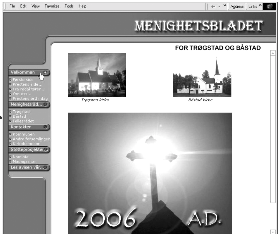
Slik kommer det til å se ut. Men i farger!