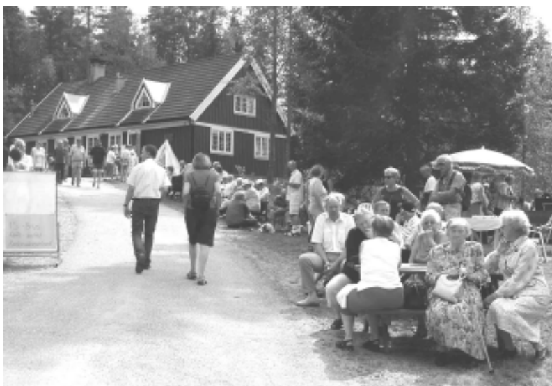
Mange var kommet ut i den vakre været! En dag å minnes når kulda kommer?