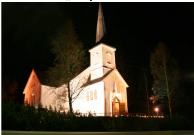
Båstads vakre kirke. Et stemningsbilde.

Menighetsrådet i Båstad har i forbindelse med valg til rådet gått inn i to ulike prøveprosjekter. Det ene er at alle som er 15 år eller eldre (og medlemmer i Den norske kirke) har stemmerett ved valget. Den andre prøveordningen er å ha valg annethvert år, slik at bare halvparten av medlemmene skiftes ut ved hvert valg. Valget legges dessuten til valgdagene for kommunevalget, altså 9. og 10. september 2007. Dette er kanskje den største praktiske endringen som folk vil legge merke til.