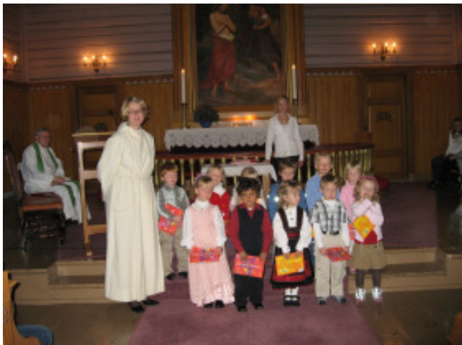
Den 14 oktober skjedde utdelingen av Min Kirkebok, og for mange småroller var dette en stor dag. Barna var like glade i Båstad kirke her...