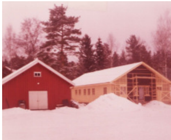
Kirkestua under bygging vinteren 1983-84.