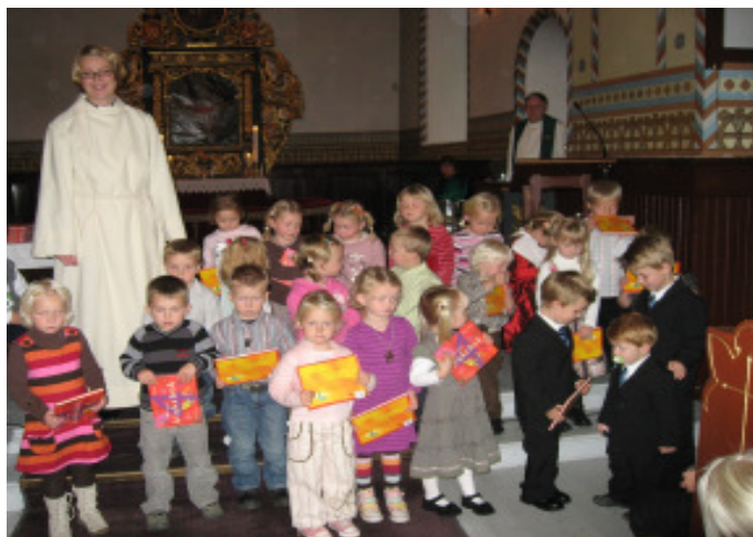
...som de var det i Trøgstad kirke her ovenfor. Vi håper at minnet varer like lenge some selve boka.